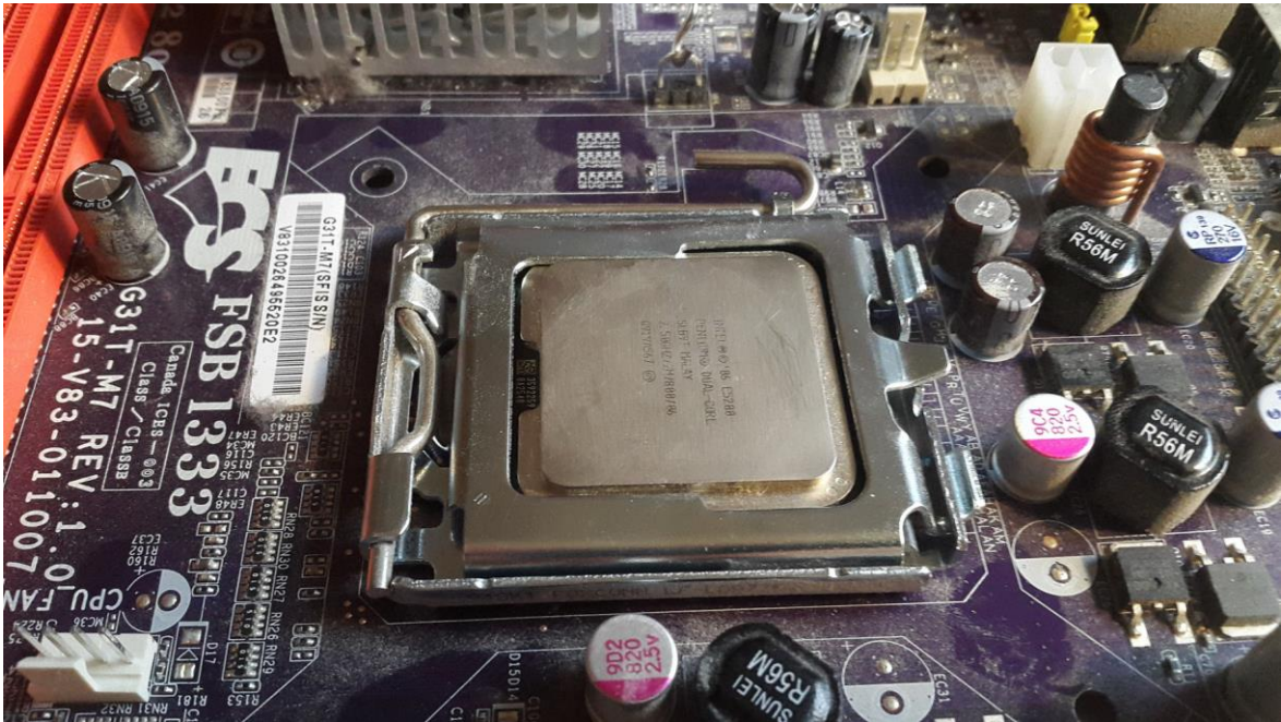
Foto 4. Termopasta hulk