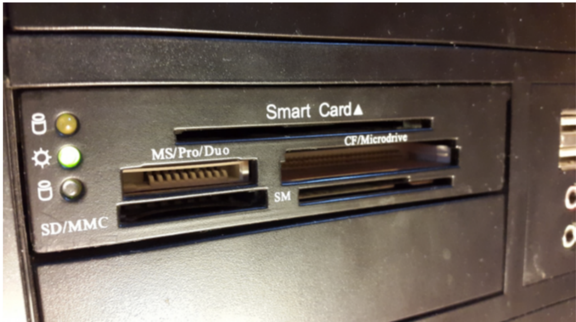
Joonis 1. Arvutisisene ID-kaardi lugeja