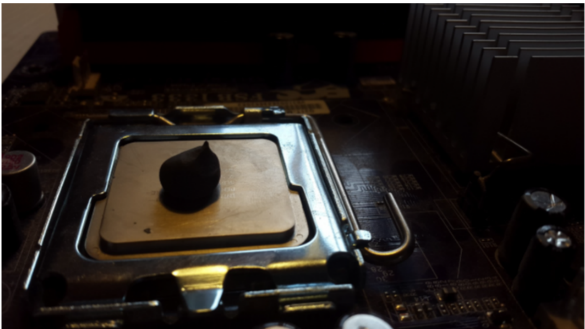
Joonis 4. Termopasta hulk