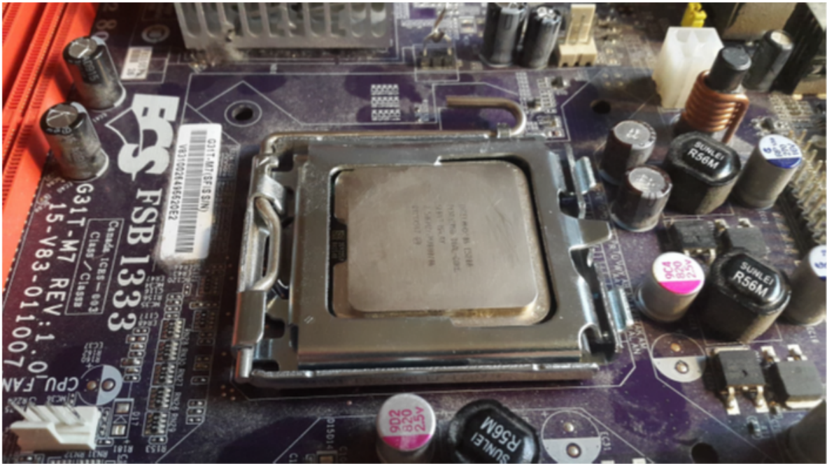
Joonis 3. Protsessori kinnitusmehhanism